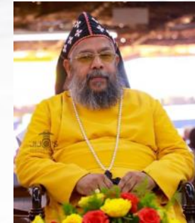
Happy Birthday (August 16)